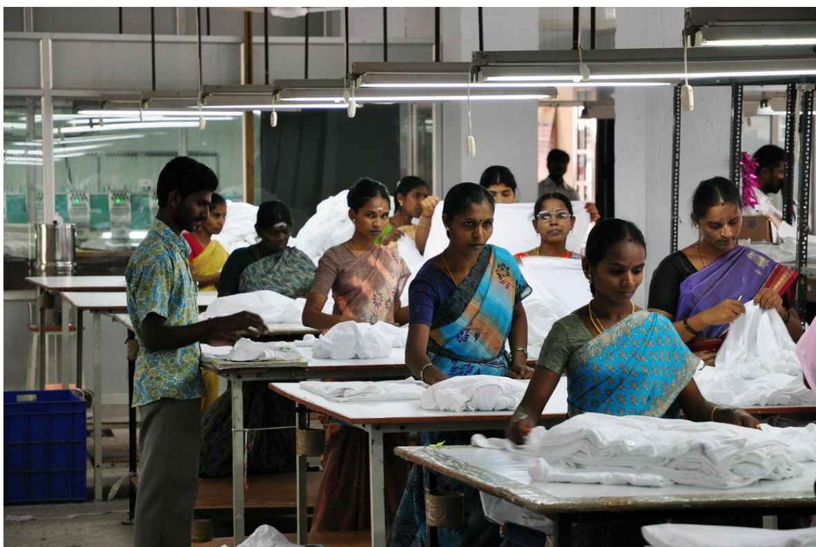
Foto: Tiripur, Indien, textilleverantör.